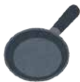
フライパンの表面加工